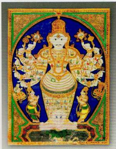
毗湿奴的宇宙形象

印度教的三大主神，在吠陀时代并非重要的神祇。根据早期的神话故事，梵天曾是一只野猪，将泥土从最初的水中提升，从而创造了世界。后来的神话传说，对梵天的出生则有至少两种说法：一是吠陀时代的造物主神“生主”将一粒种子放入水中，这粒种子变成一颗巨大无比的金蛋，一千年之后，这颗金蛋成熟了裂成两半，梵天和他的孪生妹妹娑罗室伐底就从金蛋中出生，梵天使用金蛋的一半创造了天上七层，另一半创造了地上七层的宇宙。一是在另一则神话