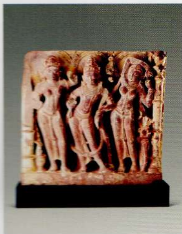
毗湿奴与他的妻子