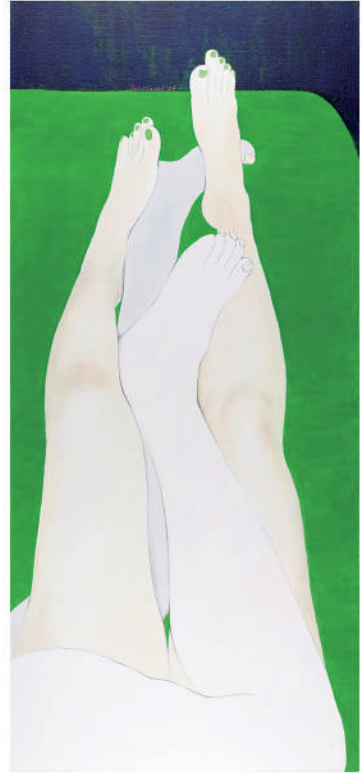
依偎3 油彩/畫布 130x50 cm. 2007