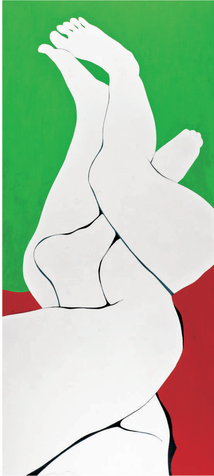
依偎2012-1 油彩/畫布 130x60x(5) cm. 2012