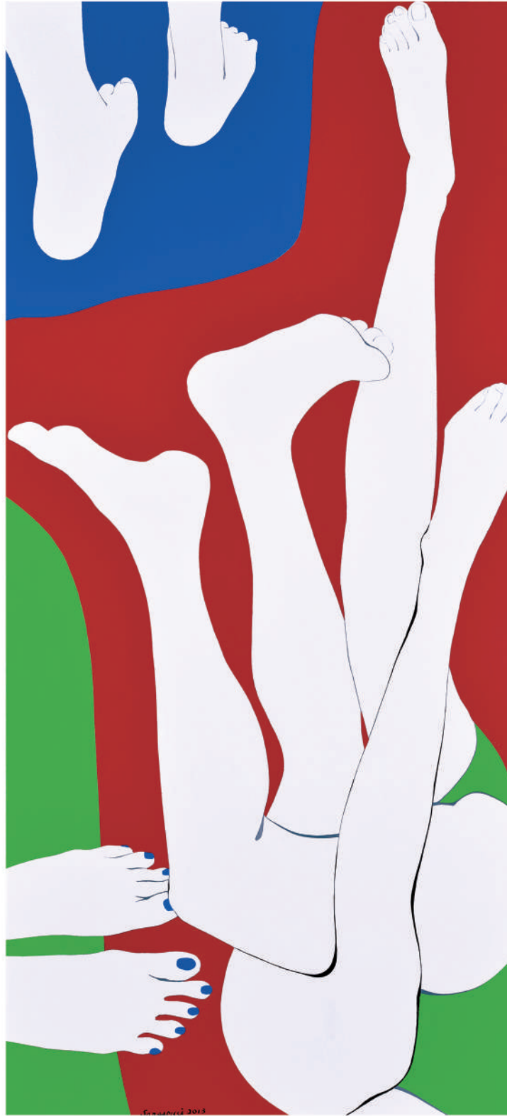
依偎2013-2 油彩/畫布 130x60x(5) cm. 2013