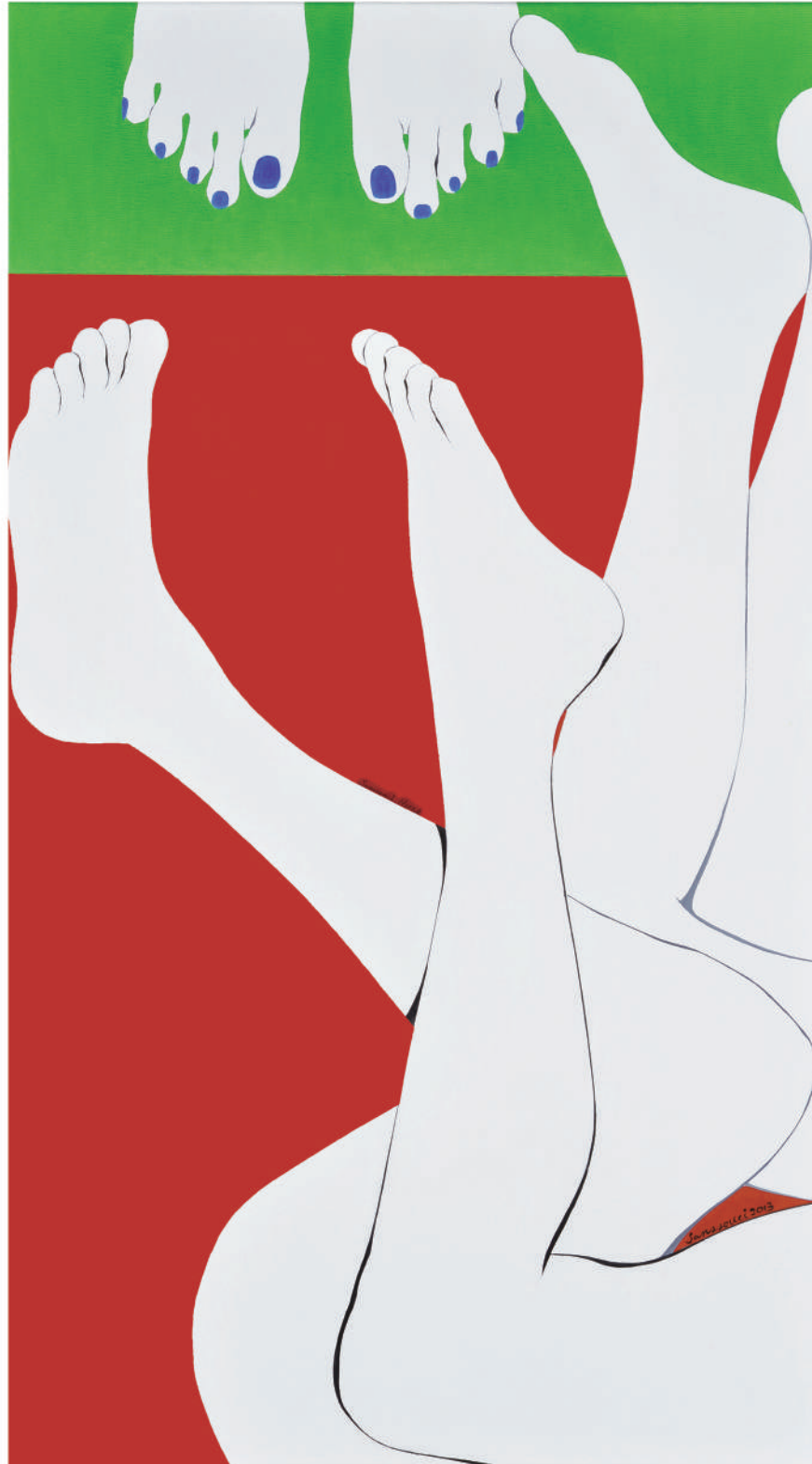
依偎2013-1 油彩/畫布 90x50 cm. 2013