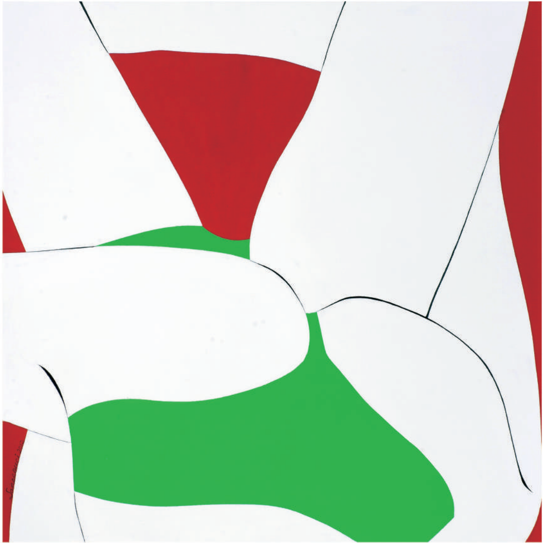
依偎2012-9 油彩/畫布 55x55x(5) cm. 2012