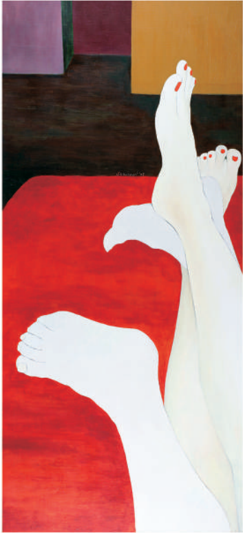
依偎1 油彩/畫布 130x50 cm. 2007