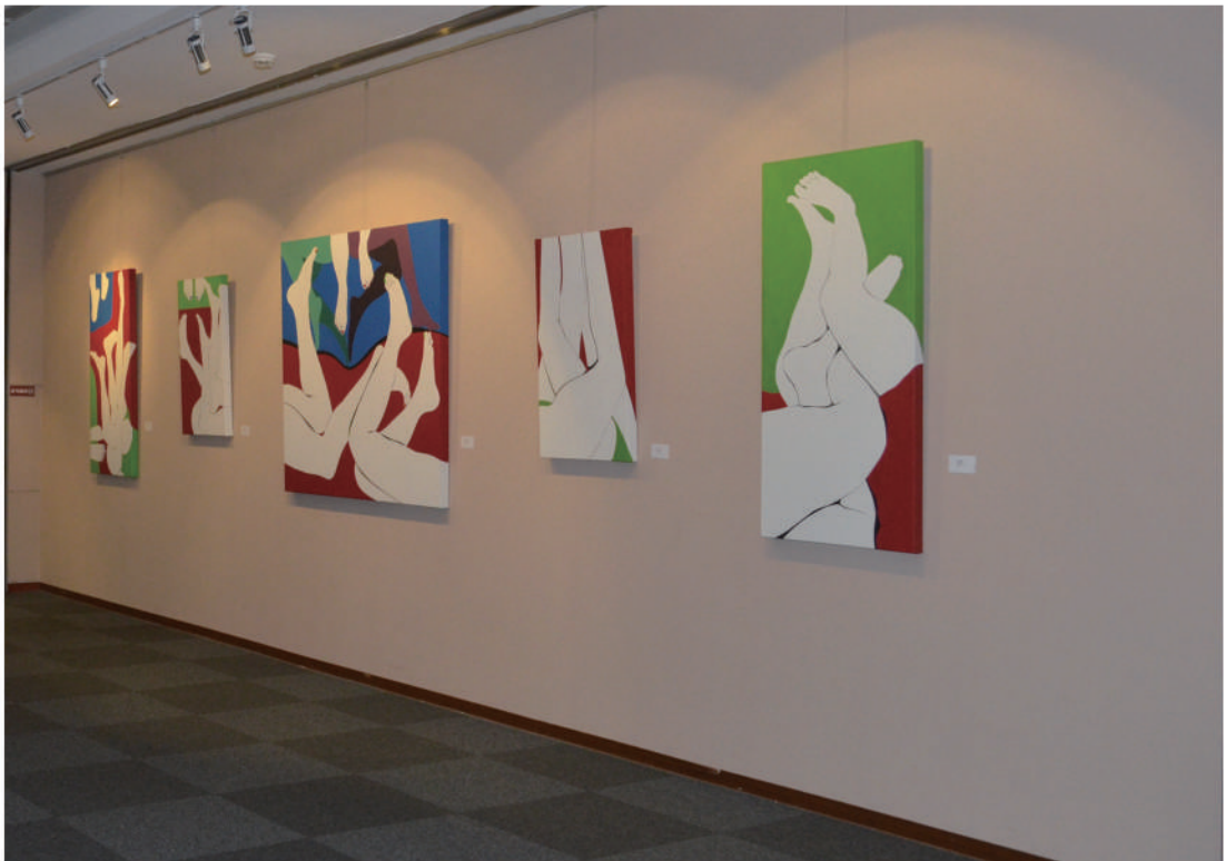
國立台灣圖書館雙和藝廊展覽之四