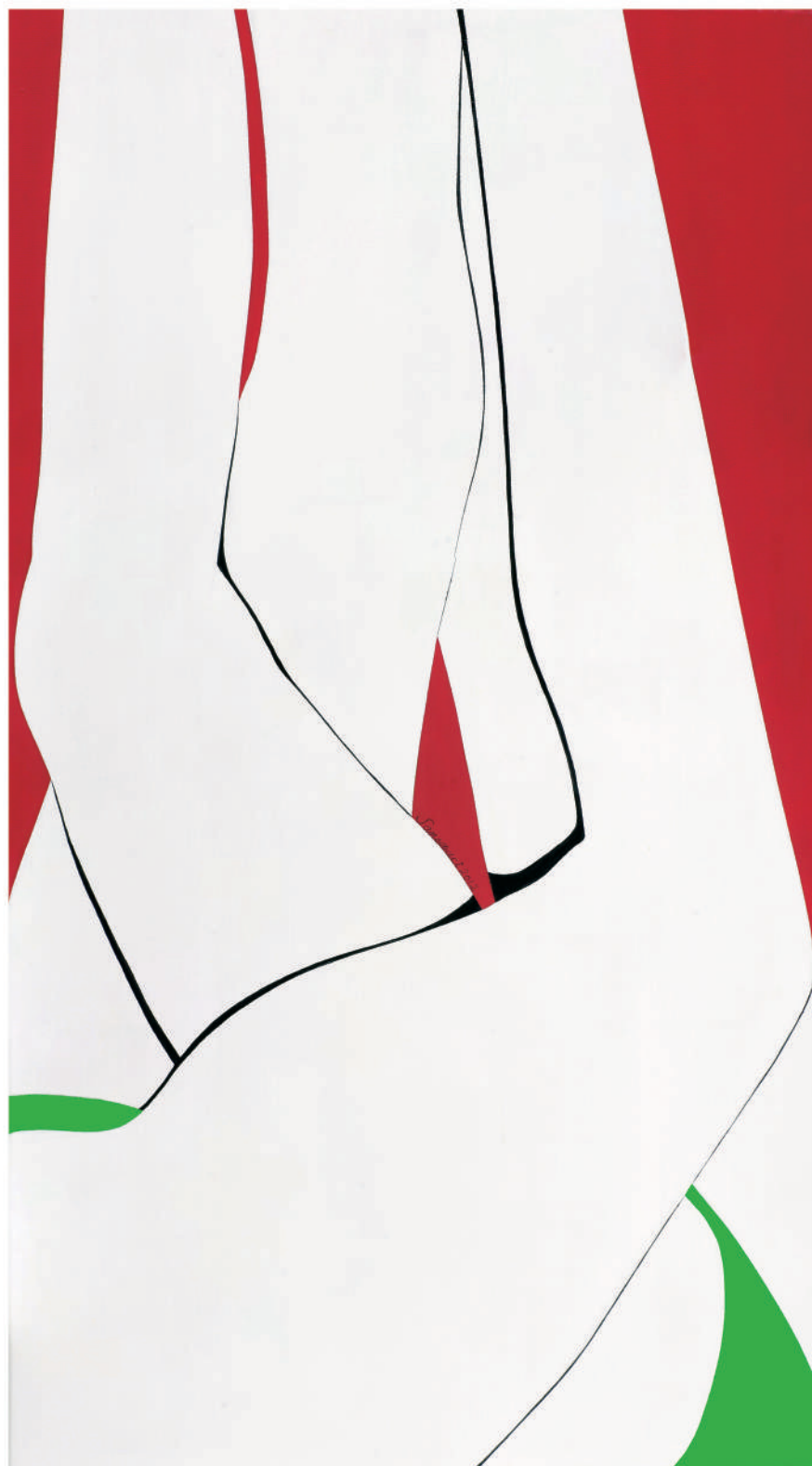
依偎2012-3 油彩/畫布 90x50x(5) cm. 2012