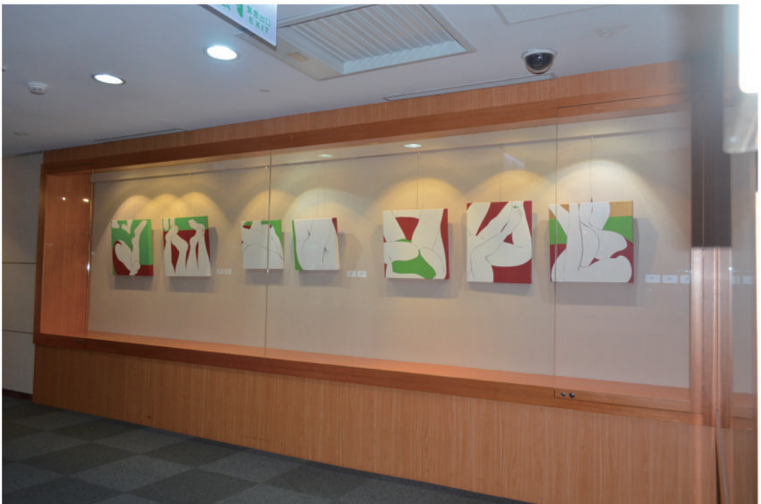
國立台灣圖書館雙和藝廊展覽之二