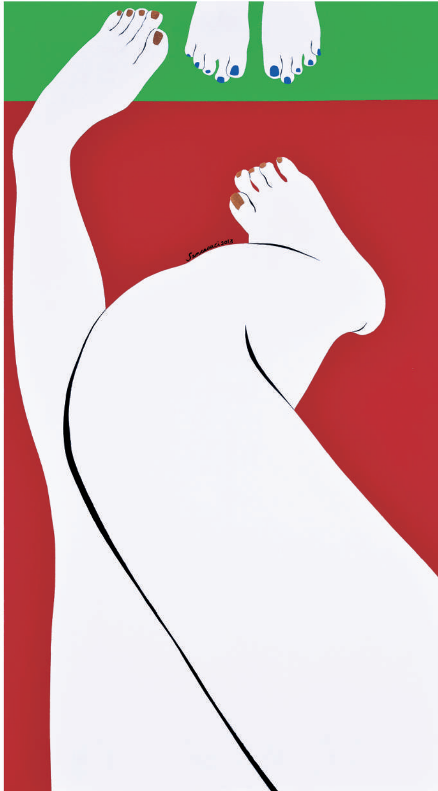
依偎2013-6 油彩/畫布 90x50x(5) cm. 2013