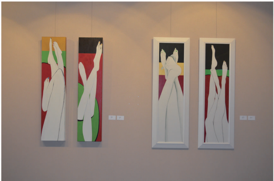
國立台灣圖書館雙和藝廊展覽之六