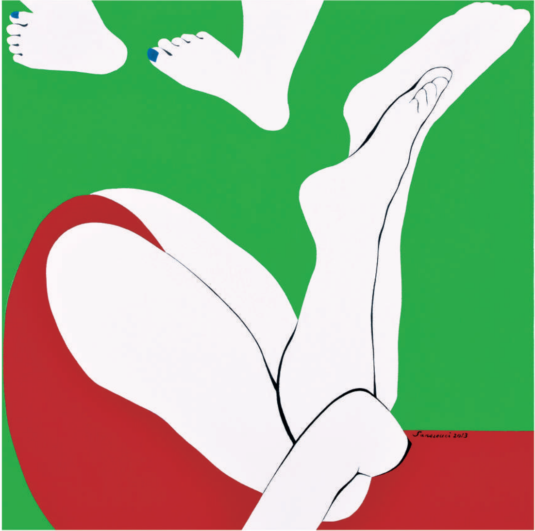
依偎2013-3 油彩/畫布 60x60x(5) cm. 2013