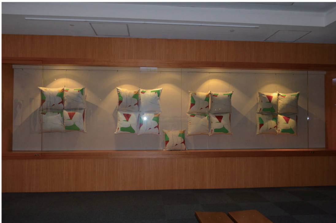
抱枕裝置 絹印布料 55x55 cm.(每個) 2012