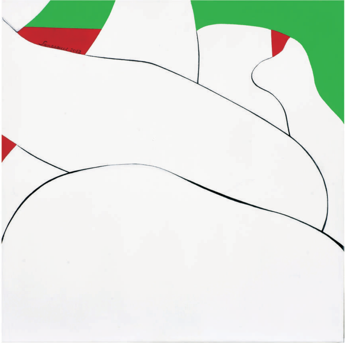
依偎2012-11 油彩/畫布 45x45x(5) cm. 2012