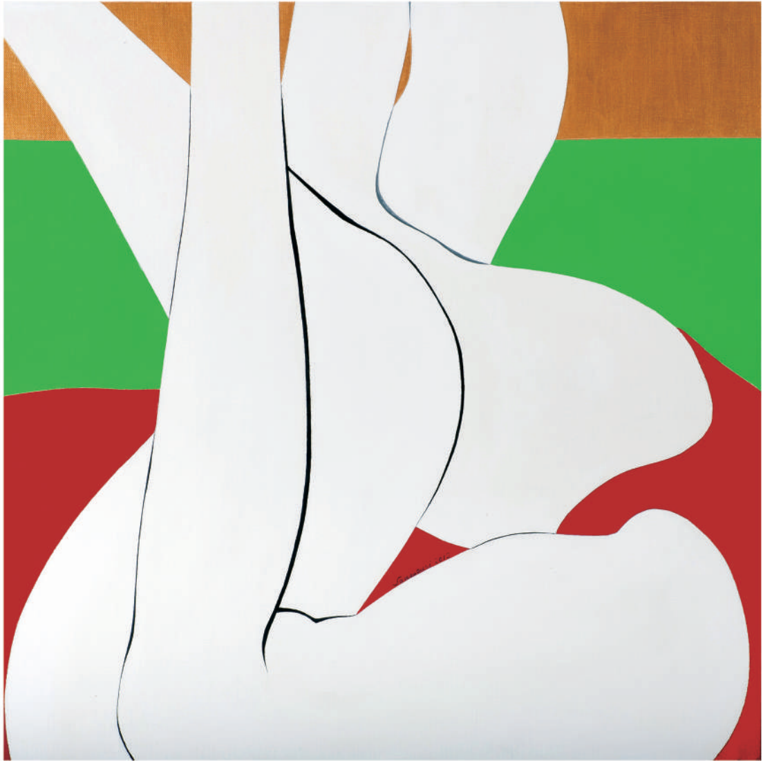
依偎2012-8 油彩/畫布 55x55x(5) cm. 2012