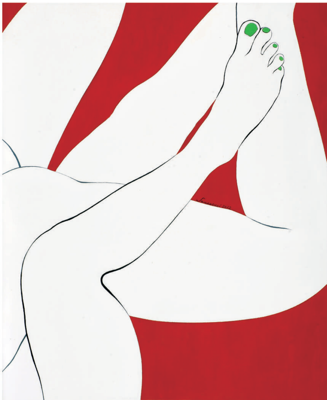
依偎2012-6 油彩/畫布 60.5x50 cm. 2012