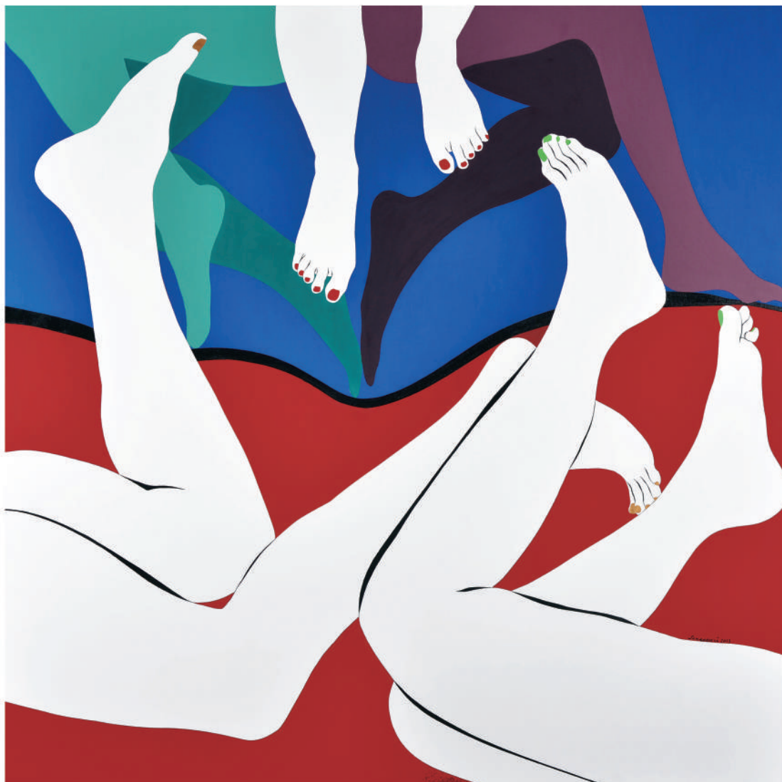
依偎2013-8 油彩/畫布 135x135x(5) cm. 2013