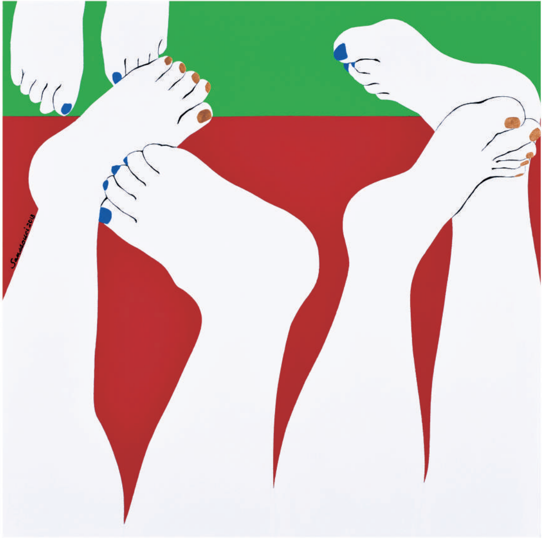
依偎2013-4 油彩/畫布 60x60x(5) cm. 2013