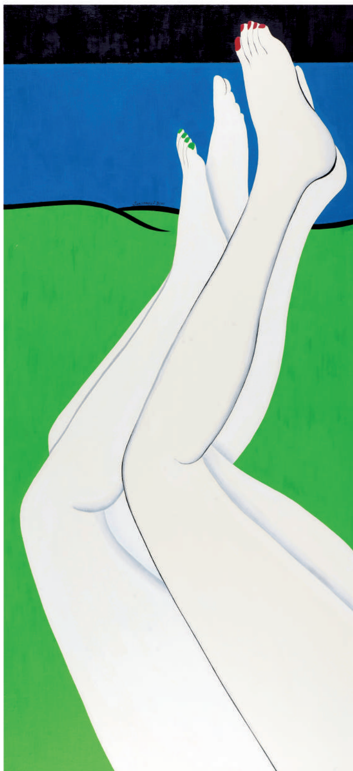
依偎2011-1 油彩/畫布 130x60x(5) cm. 2011