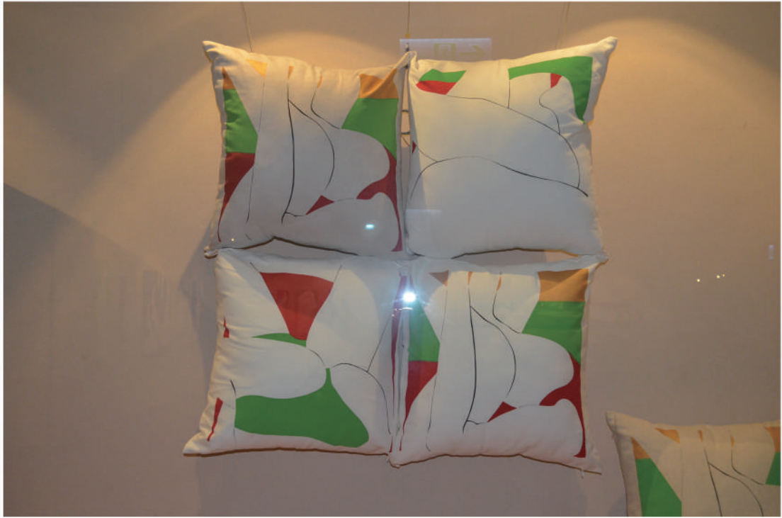
國立台灣圖書館雙和藝廊展覽之五