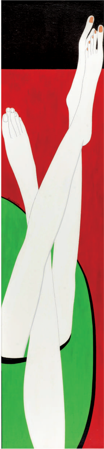
依偎2011-4 油彩/畫布 130x30x(5) cm. 2011