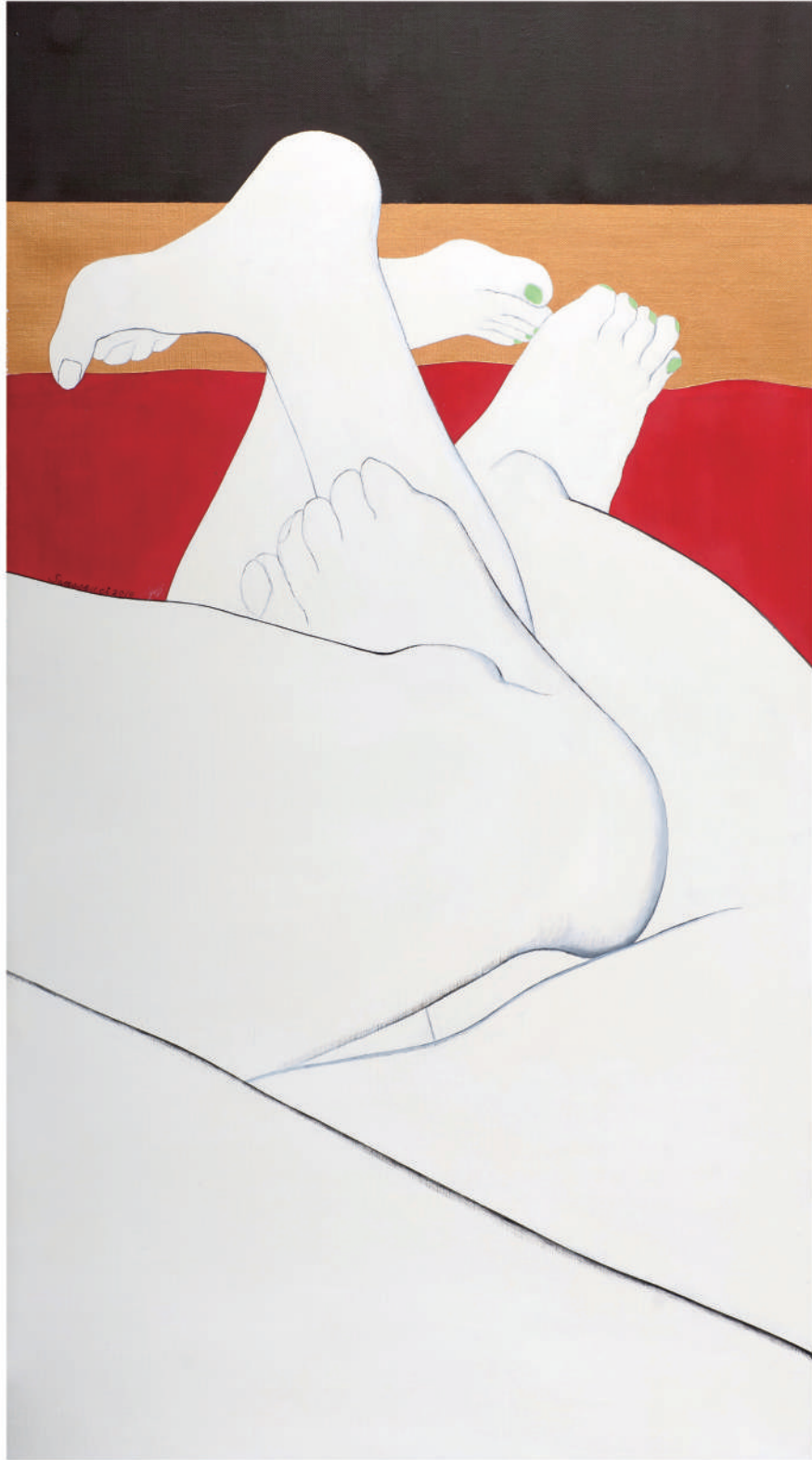
纏綿 油彩/畫布 90x50 cm. 2010