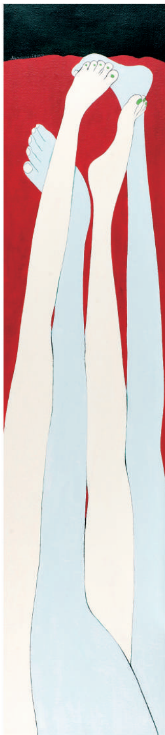
依偎2008 油彩/畫布 130x50 cm. 2008