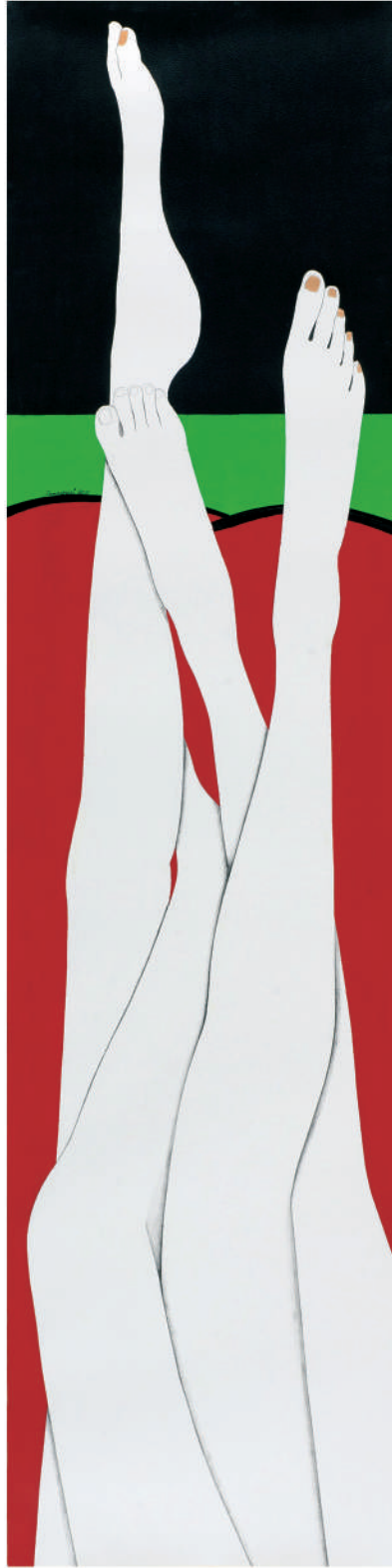
依偎2011-6 壓克力/紙 126x32 cm. 2011