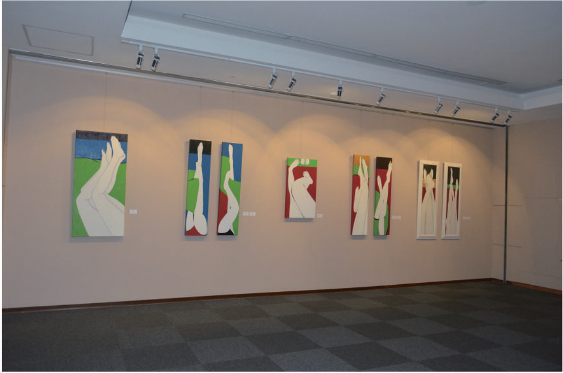
國立台灣圖書館雙和藝廊展覽之三