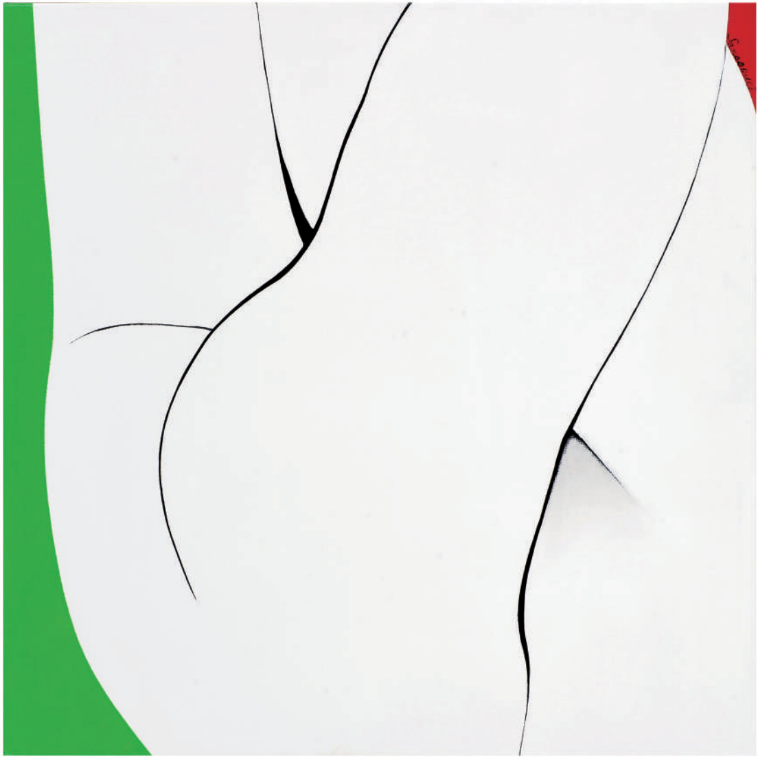
依偎2012-10 油彩/畫布 45x45x(5) cm. 2012