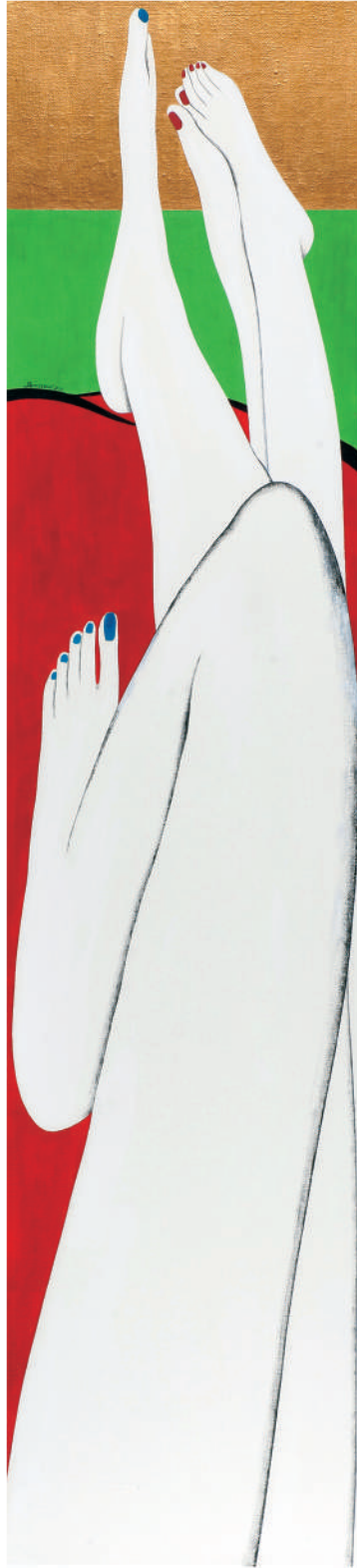
依偎2011-3 油彩/畫布 130x30x(5) cm. 2011