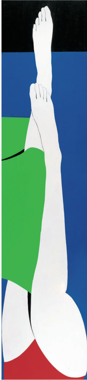
依偎2012-15 油彩/畫布 130x30x(5) cm. 2012