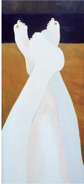
依偎2 油彩/畫布 130x50 cm. 2007