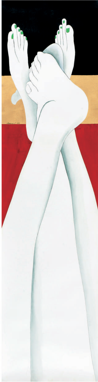
依偎2011-5 壓克力/紙 126x32.5 cm. 2011