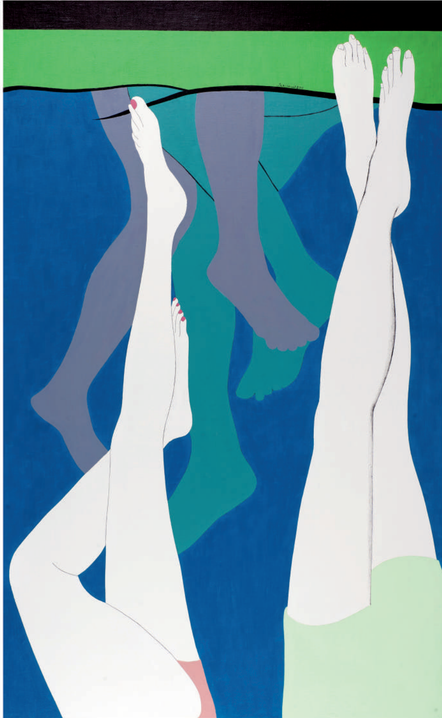
同床異夢 油彩/畫布 130x80x(5) cm. 2011