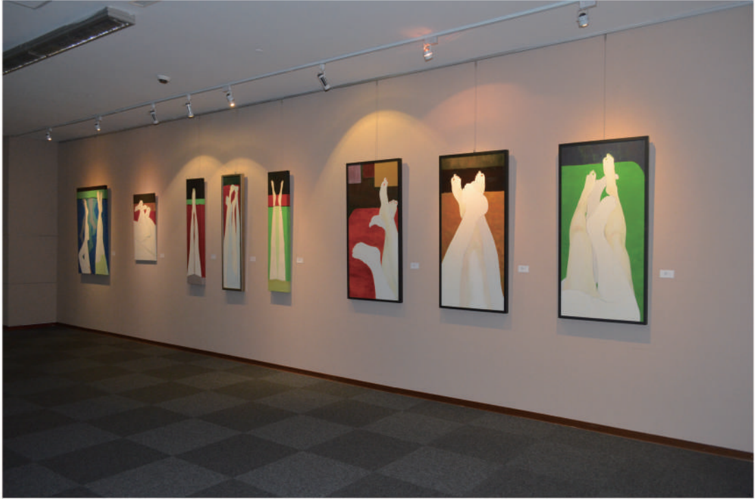
國立台灣圖書館雙和藝廊展覽之一