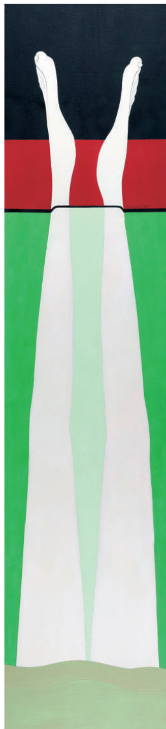
離逝 油彩/畫布 130x50 cm. 2010